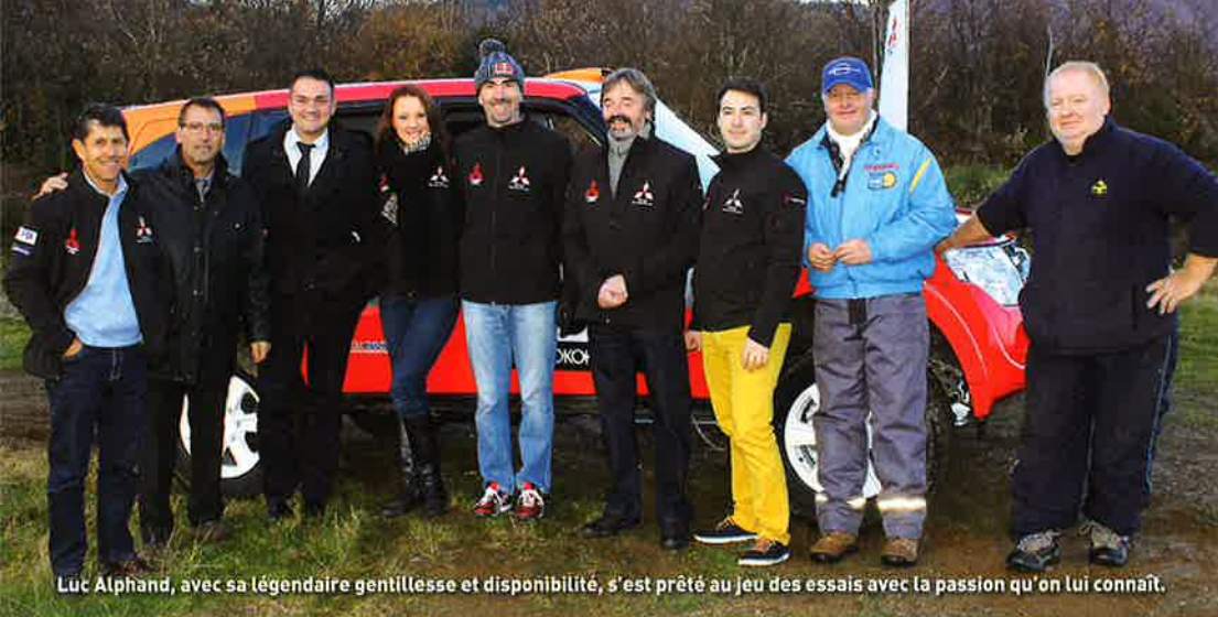
Luc Alphand, avec sa légendaire gentillesse et disponibilité, s'est prêté au jeu des essais avec la passion qu'on lui connaît.